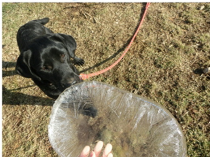
①クンクン (とりあえず匂いをかく)