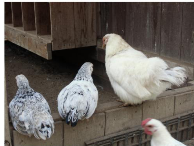
子育て中のキレ子

少しでも鶏たちが気になってもらえたらとても嬉しいです。 たくさんの鶏の中からお気に入りの子を見つけてみませんか？