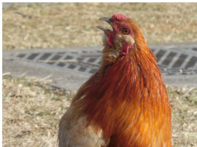
頑張っって声を出すイソじい