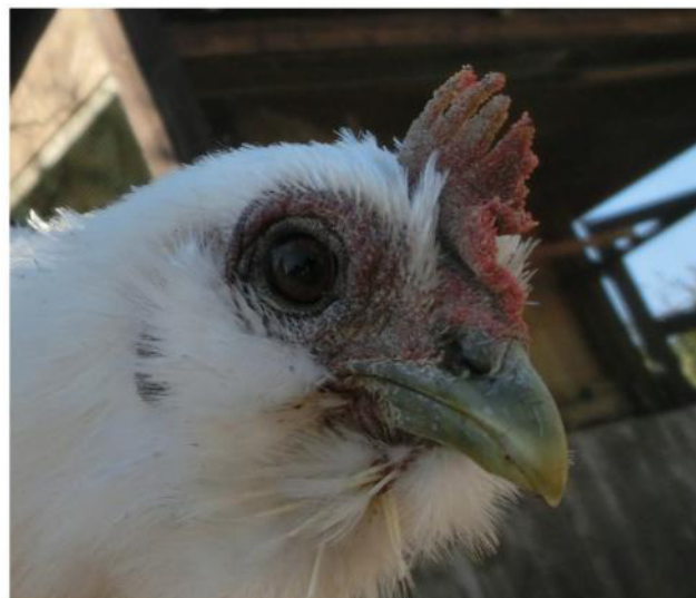
ピュレグミの鶏冠