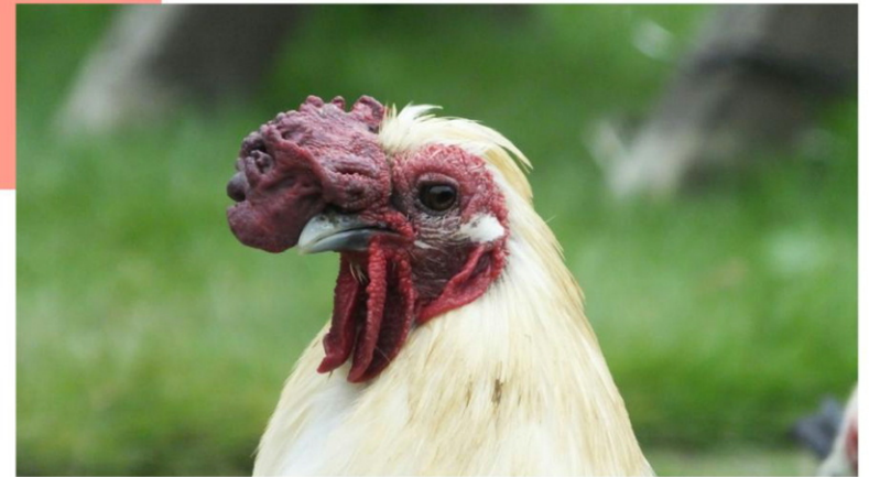
キメ顔の「きくらげ」